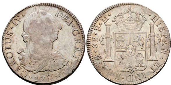
1131 CARLOS IV (1788-1808). 8 Reales. (Ar. 26,87g/38mm). 1789. México FM. Busto de Carlos III y ordinal IV. (Cal-2019-950). MBC+. Escasa. 150 €