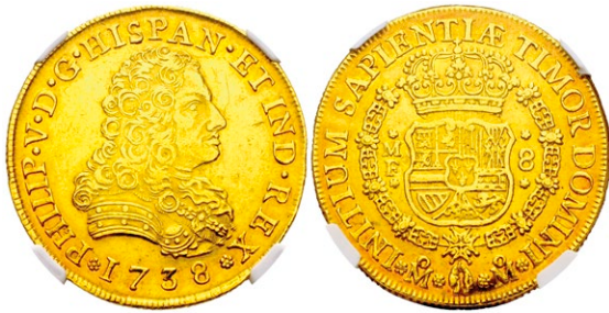
965 FELIPE V (1700-1746). 8 Escudos. (Au. 27,00g/36mm)*. 1738. México MF. (Cal-2019-2239). Encapsulada por NGC AU Details. Bonito y escaso ejemplar así. *Peso y medidas teóricos. 4.500 €