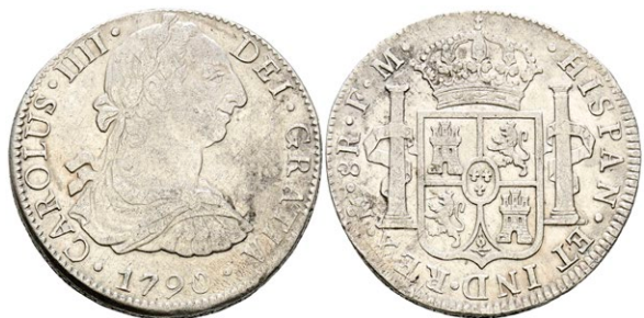
1136 CARLOS IV (1788-1808). 8 Reales. (Ar. 26,72g/38mm). 1790. México FM. (Cal-2019-952). Busto de Carlos III y ordinal III. MBC+. Escasa. 130 €