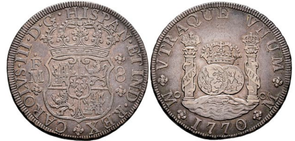
1051 CARLOS III (1759-1788). 8 Reales (Ar. 26,82g/39mm). 1770. México FM. (Cal-2019-1101). MBC+. Pátina. 320 €