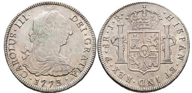
1074 CARLOS III (1759-1788). 8 Reales. (Ar. 26,97g/41mm). 1773. Potosí JR. (Cal-2019-1169). MBC+/EBC-. Restos de brillo original. Bonito ejemplar. 100 €