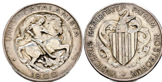
1573 ALFONSO XIII (1885-1931). 5 Pesetas. (Ar. 24,87g/37mm). 1900. Barcelona (Unión Catalanista). (Cal-2019-135). EBC. Bonito y escaso ejemplar. 600 €

Las propuestas regionalistas catalanas tienen su origen en el descontento de ciertos sectores de la sociedad ante la Constitución de 1876. Todas estas corrientes consiguieron ser canalizadas en 1891 en la llamada Unión Catalanista, una amalgama de asociaciones y entidades, en ocasiones de ideología dispar, que nunca llegó a cristalizar en un partido político propiamente dicho aunque hicieran un intento algo tardío por presentarse a las elecciones de 1903, cuando ya eran un movimiento sin apenas eco en la política catalana. Aun así, no fue hasta el estallido de la Guerra Civil cuando se certificó su desaparición. Con el fin de recaudar fondos y también con cierto carácter conmemorativo, se tomó la decisión en el año 1900, de acuñar unas medallas de claras influencias modernistas que, dadas sus similitudes en módulo, metal y peso con las monedas contemporáneas terminaron siendo usadas como tales en pequeños círculos cercanos a estas asociaciones, adquiriendo desde estos momentos un sentido de moneda para el que realmente no fueron acuñadas.