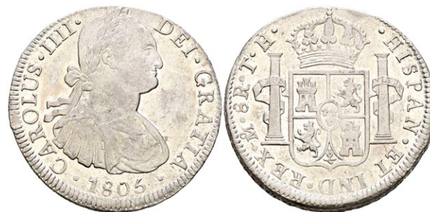
1174 CARLOS IV (1788-1808). 8 Reales. (Ar. 27,00g/40mm). 1805. México TH. (Cal-2019-983). EBC-. Restos de brillo original. Bonito ejemplar. 90 €