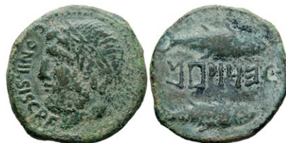
235 KETOVION (Alcácer do Sal, Portugal). As. (Ae. 10,45g/29mm). 150-50 a.C. (FAB-1632). Anv: Cabeza laureada y barbada masculina a derecha, delante leyenda: CAND NIL SISR F. Rev: Dos atunes a derecha, entre ellos leyenda púnica: KeToVION. MBC-. Raro ejemplar. 250 €