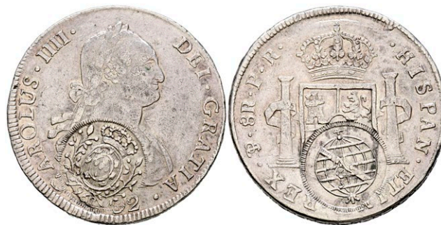
1189 CARLOS IV (1788-1808). 8 Reales (Ar. 26,66g/42mm). 1792. Potosí PR. (Cal-2019-992). Resello de Minas Gerais para circular por Brasil como 960 reis. MBC. Preciosa pátina. 300 €