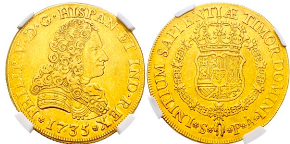
966 FELIPE V (1700-1746). 8 Escudos. (Au. 27,00g/36mm)*. 1735. Sevilla PA. (Cal-2019-2311). Encapsulada por NGC XF 45. *Peso y medida teóricos. 4.000 €