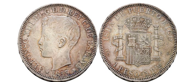
1568 ALFONSO XIII (1885-1931). 1 Peso. (Ar. 24,95g/38mm). 1895. Puerto Rico PGV. (Cal-2019-128). MBC+. Preciosa pátina. 400 €