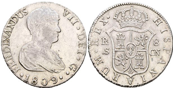
1343 FERNANDO VII (1808-1833). 8 Reales (Ar. 26,97g /40mm). 1809. Sevilla CN. Busto desnudo. (Cal-2019-1412). EBC. Ligeras rayitas en anverso. Brillo original. Escaso ejemplar así. 350 €