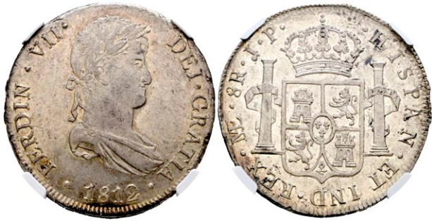
1300 FERNANDO VII (1808-1833). 8 Reales. (Ar. 27,00g/39mm)*. 1812. Lima JP. (Cal-2019-1244). Encapsulada por NGC MS 61. *Peso y medida teóricos. Escaso así. 250 €