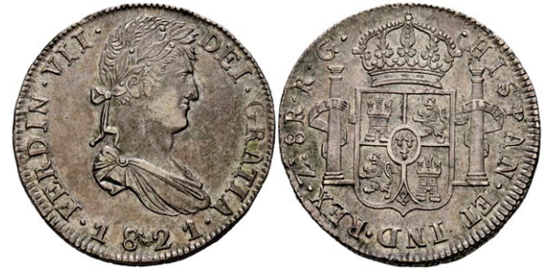
1351 FERNANDO VII (1808-1833). 8 Reales. (Ar. 27,17g/38mm). 1821. Zacatecas RG. (Cal-2019-1465). EBC. Escaso así. 250 €