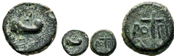
168 CARTAGONOVA (Cartagena, Murcia). Cuadrante. (Ae. 2,74g/15mm). 50-30 a.C. (FAB-575). Anv: Proa a derecha, entre leyenda: CA/EDI. Rev: Ancla entre leyenda: PO/PIL. MBC. Muy raro. 300 €