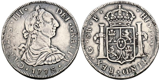
1023 CARLOS III (1759-1788). 8 Reales (Ar. 26,66g/40mm). 1773. Guatemala P. (Cal-2019-1006). MBC. Rara. 400 €