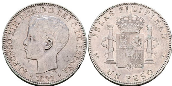
1563 ALFONSO XIII (1885-1931). 1 Peso. (Ar. 25,06g/37mm). 1897. Manila SGV. (Cal-2019-122). MBC+. Marquitas. 100 €