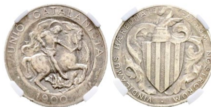
1572 ALFONSO XIII (1885-1931). 1 Peseta. (Ar. 5,00g /23mm)*. 1900. Unión Catalanista. Talleres Vallmitjana. (Cal-2019-134). Encapsulada por NN Coins AU 58. * Peso y medidas teóricos. 200 €

Las propuestas regionalistas catalanas tienen su origen en el descontento de ciertos sectores de la sociedad ante la Constitución de 1876. Todas estas corrientes consiguieron ser canalizadas en 1891 en la llamada Unión Catalanista, una amalgama de asociaciones y entidades, en ocasiones de ideología dispar, que nunca llegó a cristalizar en un partido político propiamente dicho aunque hicieran un intento algo tardío por presentarse a las elecciones de 1903, cuando ya eran un movimiento sin apenas eco en la política catalana. Aun así, no fue hasta el estallido de la Guerra Civil cuando se certificó su desaparición. Con el fin de recaudar fondos y también con cierto carácter conmemorativo, se tomó la decisión en el año 1900, de acuñar unas medallas de claras influencias modernistas que, dadas sus similitudes en módulo, metal y peso con las monedas contemporáneas terminaron siendo usadas como tales en pequeños círculos cercanos a estas asociaciones, adquiriendo desde estos momentos un sentido de moneda para el que realmente no fueron acuñadas.