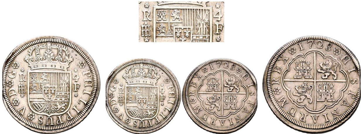
937 FELIPE V (1700-1746). 4 Reales. (Ar. 13,42g/35mm). 1728. Segovia F. (Cal-2019-1215). EBC-. Escasa y más en esta calidad. 900 €