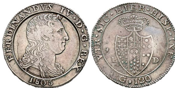
1218 FERNANDO IV (Infante de España). Piastra de 120 Grana (Ar. 27,44g/38mm). 1805. Nápoles. (Vicenti-308). MBC+. Escasa así. 200 €