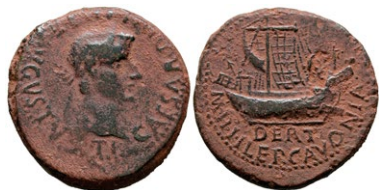
224 ILERGAVONIA (Tortosa, Tarragona). As. (Ae. 7,36g/25mm). 14-36 d.C. (FAB-1493). Anv: Cabeza laureada de Tiberio a derecha, alrededor leyenda: TI CAESAR DIVI AVG AVGVSTVS. Rev: Nave, debajo: DERT/ILRECAVONIA. MBC-/MBC. 200 €