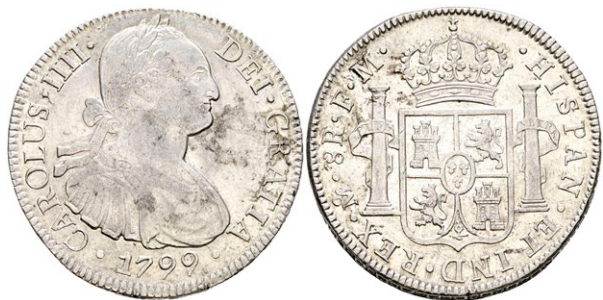
1158 CARLOS IV (1788-1808). 8 Reales. (Ar. 26,94g/38mm). 1799. México FM. (Cal-2019-963). EBC. 120 €