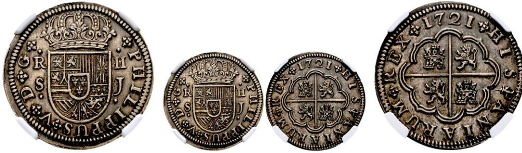
932 FELIPE V (1700-1746). 2 Reales. (Ar. 6,00g/26mm)*. 1721. Sevilla J. (Cal-2019-979). Encapsulada por NGC MS 62. Preciosa pátina. *Peso y medida teóricos. Escaso así. 125 €