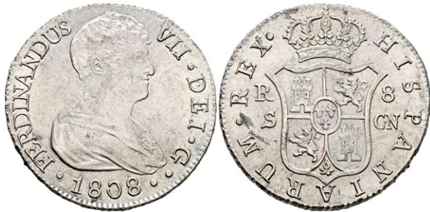
1342 FERNANDO VII (1808-1833). 8 Reales (Ar. 27,07g/40mm). 1808. Sevilla CN. Busto desnudo. (Cal-2019-1411). EBC. Brillo original. Precioso ejemplar escaso así. 350 €