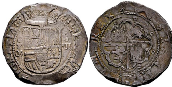
859 FELIPE II (1556-1598). 8 Reales. (Ar. 27,43g/41mm). S/D (desde 1578). Toledo M. (Cal-2019-749). Error en valor: VII. MBC+. Bonito ejemplar. 600 €

Las Pragmáticas de la Nueva Estampa (finales de 1566) es la gran reforma monetaria que se lleva a cabo en tiempos de Felipe II. El objetivo no era otro que renovar la tipología de la moneda castellana en su totalidad: vellón, plata y oro. En esta nueva tipología se prima a Castilla como centro neurálgico de la Monarquía Hispánica, siendo las armas del rey las que dominen el anverso de la pieza, tanto en el oro como en la plata, abandonándose el contracuartelado por un escudo cortado de clara influencia de los Reyes Católicos. En los reversos continúa el cuartelado de castillos y leones típico de la Corona de Castilla.