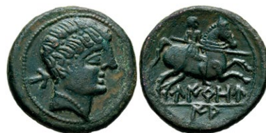
311 UIOURIAS (Borobia, Soria). As. (Ae. 8,75g/25mm). 120-20 a.C. (FAB-2483). Anv: Cabeza masculina a derecha, detrás letra ibérica: U. Rev: Jinete con lanza a derecha, debajo leyenda ibérica en dos partes con líneas entre ellas: UIROU/IAS. MBC+. 400 €