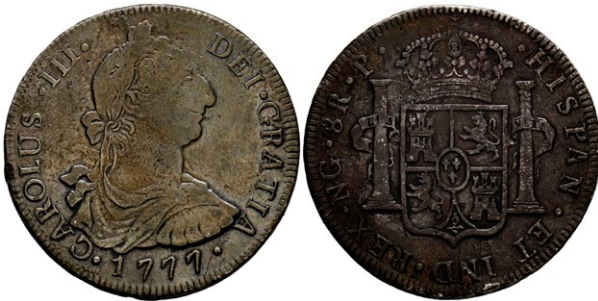
1024 CARLOS III (1759-1788). 8 Reales. (Ar. 26,47g/40mm). 1777. Guatemala P. (Cal-2019-1009). MBC+. Oxidaciones y bonita pátina oscura. Escasa. 350 €