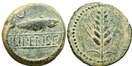
228 ILIPENSE (Alcalá del Río, Sevilla). As. (Ae. 15,11g/30mm). 120-20 a.C. (FAB-1531). Anv: Sábalo a derecha, debajo leyenda dentro de cartela: ILIPENSE. Rev: Espiga. MBC. 250 €