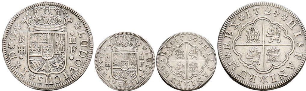
967 LUIS I (1724). 2 Reales. (Ar. 5,71g/26mm). 1724. Segovia F. (Cal-2019-28). MBC+. Escasa y más así.