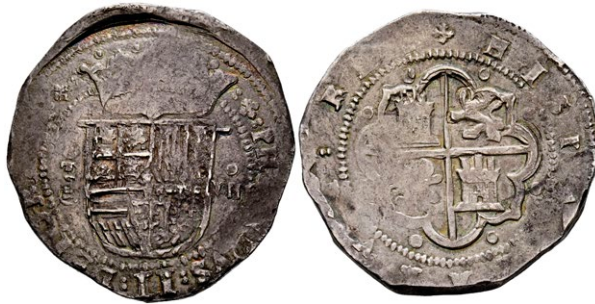
858 FELIPE II (1556-1598). 8 Reales. (Ar. 27,33g/39mm). S/D (desde 1578). Toledo M. (Cal-2019-748). MBC+. Bonita pátina. 600 €