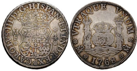
1021 CARLOS III (1759-1788). 4 Reales. (Ar. 13,27g/32mm). 1768. México MF. (Cal-2019-881). MBC. 250 €