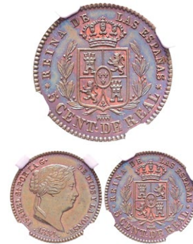
1376 ISABEL II (1833-1868). 5 Céntimos de Real (Ae. 2,00g/17mm)*. 1854. Segovia. (Cal-2019-159). Encapsulado por NGC. MS 65 BN. Escasa y espectacular pieza.* Peso y medidas teóricos. 1.000 €