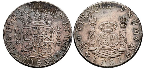
1033 CARLOS III (1759-1788). 8 Reales. (Ar. 27,07g/38mm). 1761. Mexico MM. (Cal-2019-1075). Cruz entre H e I. EBC. Preciosa pátina. 350 €