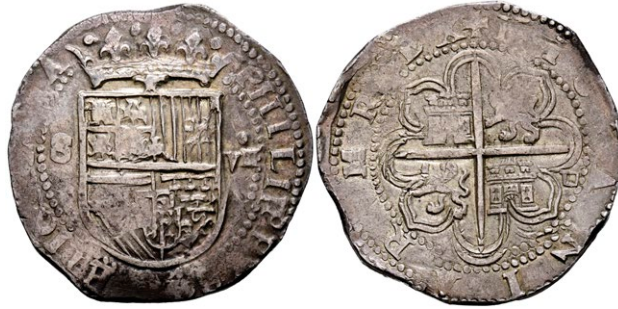
857 FELIPE II (1556-1598). 8 Reales. (Ar. 27,43g/41mm). S/D (antes de 1588). Sevilla D. (Cal-2019-720). EBC-. Preciosa pátina. Magnífico ejemplar. 600 €