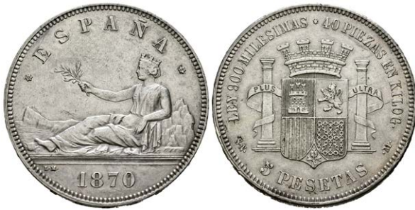
774 GOBIERNO PROVISIONAL (1868-1871). 5 Pesetas. (Ar. 24,92g/37mm). 1870 *18-70. Madrid SMN. (Cal-2019-39). EBC. Ínfimas marquitas. Leves restos de brillo original. Adquirida en Aureo en los años 90. 250 €