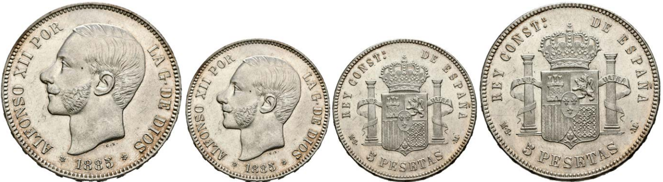
795 ALFONSO XII (1874-1885). 5 Pesetas. (Ar. 24,98g/37mm). 1885 *18-87. Madrid MSM. (Cal-2019-62). SC-. Ínfimas marquitas. Espectacular ejemplar y más en esta preciosa calidad manteniendo su pleno brillo original. Adquirida en Aureo en los años 90. 700 €

La prematura muerte por tuberculosis de Alfonso XII abrió un periodo de regencia que en el plano numismático se reflejó en una continuidad de los tipos, sin modificaciones. Se siguió usando para las 5 Pesetas las acuñaciones de 1885 a las que se añadió en la estrella la fecha del 87, año real de su acuñación. En agosto de ese mismo año, 1887, se aprueban las primeras monedas a nombre del nuevo rey, niño aún, y que verían la luz un año después en 1888 y en forma del popular "pelón".