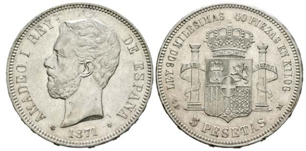
781 AMADEO I (1871-1873). 5 pesetas. (Ar. 24,87g/37mm). 1871 *18-71. Madrid SDM. (Cal-2019-1). EBC-. Adquirida en Aureo en los años 90. 80 €