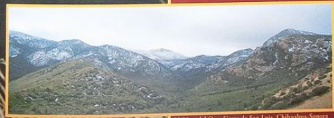
Habitat del Oso. Sierra de San Luis, Chihuahua-Sonora Oscar Moctezuma O.

El oso negro ocupa territorios muy grandes; por ello, la destrucción de los bosques y la cacería han provocado su desaparición de muchas zonas. Se considera en nuestro país como una especie en peligro de extinción.