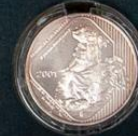
Perrito de las Praderas