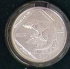
Nutria de Río