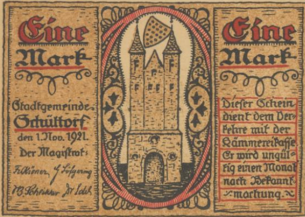
Druck von Adolf Forker, Leipzig.