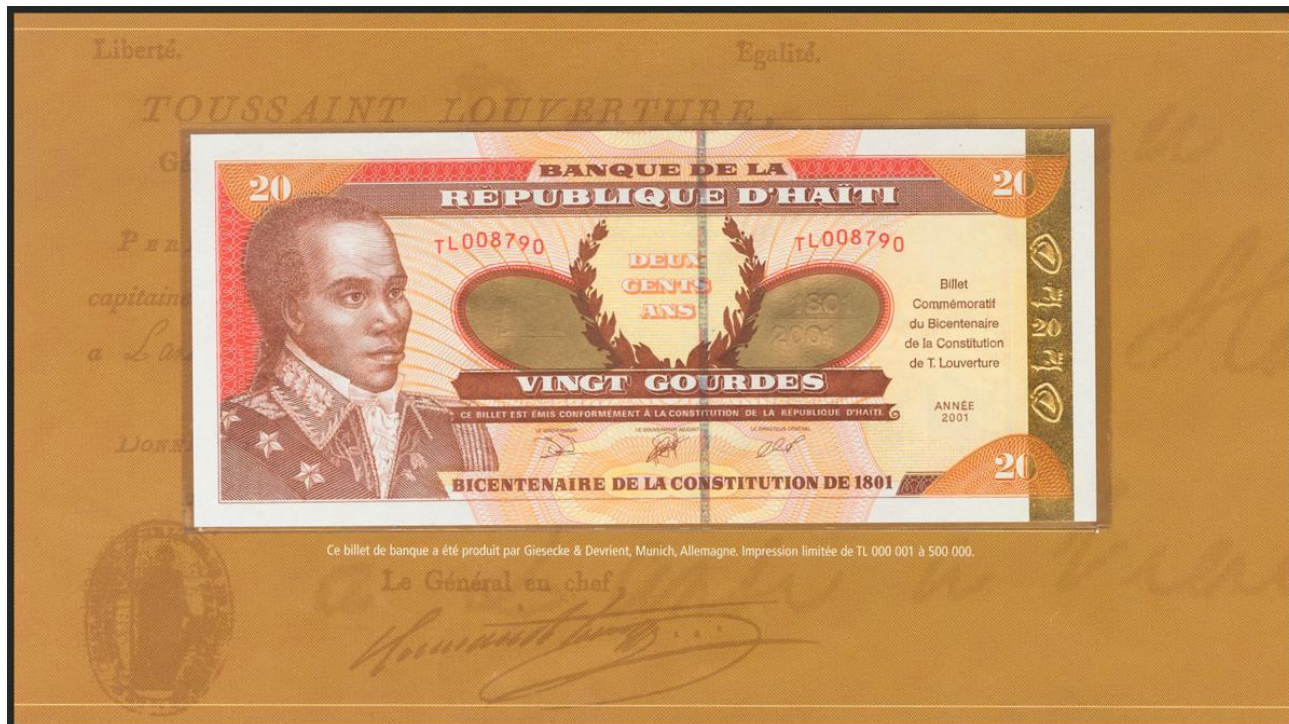
Ce billet de banque a été produit par Giesecke & Devrient, Munich, Allemagne. Impression limitée de TL 000 001 à 500 000.

HAITI. 20 Gourdes. 2001. Memorial. (Pick: 271A). Uncirculated.